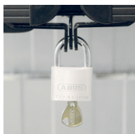
Support et verrou pour verrouillage des ailes latérales devant l'écran