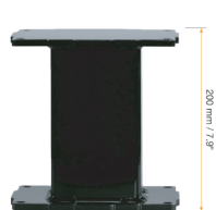
Rallonge pour colonne aluminium ajustable en 2 parties